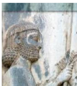
(ه) روش پیشنهادی در این مقاله بدون مرحله‌ی آمیختن با تبدیل موجک

شکل ۴: بزرگ شده‌ی قسمتی از نتیجه‌ی اجرای شیوه‌های مختلف برای افزایش وضوح شکل ۲(الف). دقیق‌تر بودن مدل در شیوه‌ی پیشنهادی نسبت به شیوه‌ی ذکر شده در [۴] که فاقد ثبت تصویر مبتنی بر ناحیه است از مقایسه‌ی قسمت بالای نیزه در شکل‌های (و) و (د) مشخص است.